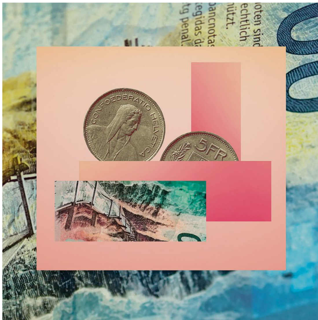
Illustration: Suse Heinz

Für die Stiftungsrate der Gemeinschafts- und Sammelstiftungen ist der Zinsentscheid jedes Jahr eine Gratwanderung. Es ist ihre Aufgabe zu entscheiden, welcher Anteil der Rendite in Form von Zinszahlungen an die aktiv Versicherten geht und wie viel in die Reserven fließt. Einzelne Pensionskassen sahen sich nach dem Endjahresrallye an den Börsen gezwungen, den Versicherten 2021 eine einmalige Zusatzverzinsung zu gewähren. So schreiben etwa Futura und PKG ihren Versicherten dieses Jahr eine zusätzliche Verzinsung gut. Dieses kurzfristige Supplement wird die Versicherten freuen, sie erhalten so einen Teil der Rendite direkt auf dem Vorsorgekonto gutgeschrieben und profitieren später von höheren Altersleistungen.