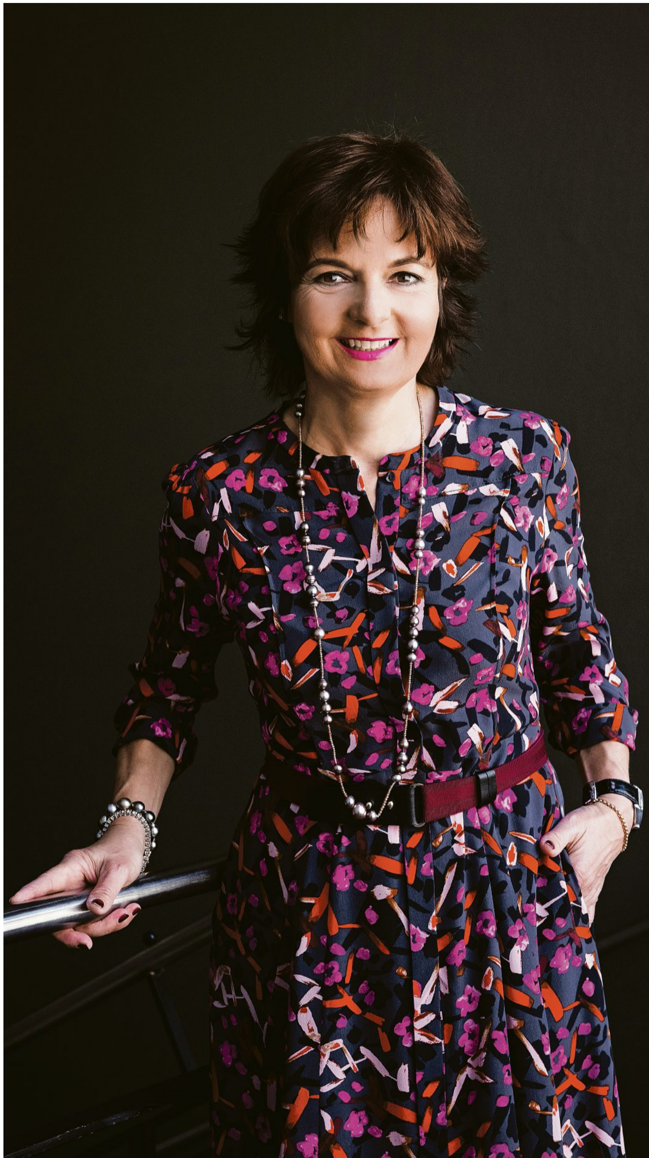
«Erzielen Frauen ein höheres Erwerbseinkommen, verbessert sich automatisch auch ihre Altersvorsorge»: Ruth Metzler-Arnold

Wenn die Rahmenbedingungen endlich stimmen – nebst der Individualbesteuerung vor allem auch die Vereinbarkeit von Beruf und Familie – werden Zehntausende von Frauen zu einem erhöhten Prozentsatz beziehungsweise überhaupt wieder arbeiten. Zu diesem Schluss kommen verschiedene Studien im Zusammenhang mit der Individualbesteuerung. Erzielen sie ein höheres Erwerbseinkommen, verbessert sich automatisch auch ihre Altersvorsorge.