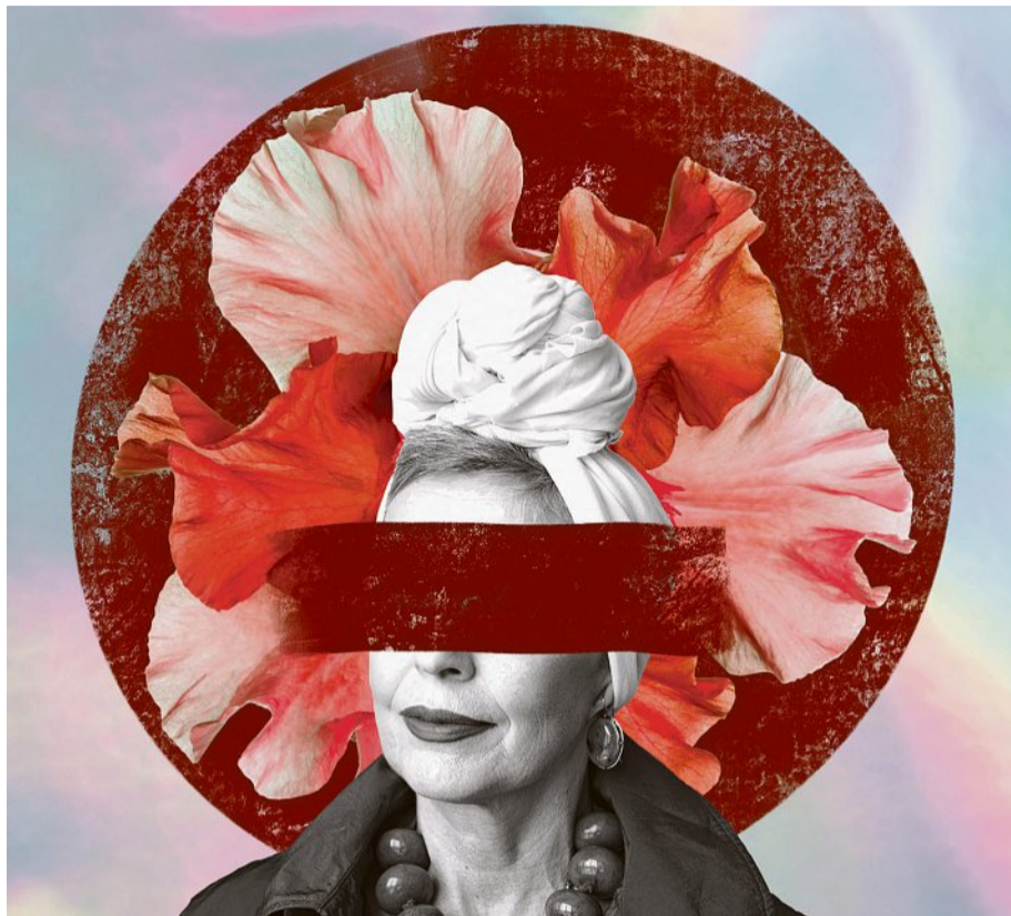
Illustration: Suse Heinz

Dies zeigt, dass eine Querfinanzierung nur möglich ist, wenn im Zeitpunkt der Pensionierung ausreichend überobligatorisches Guthaben vorhanden ist. Für angehende Pensionäre, die lediglich obligatorisches Sparkapital haben, muss die Rente nach den geltenden Mindestvorgaben berechnet und gegebenenfalls durch die Vollversicherung aufgestockt werden.