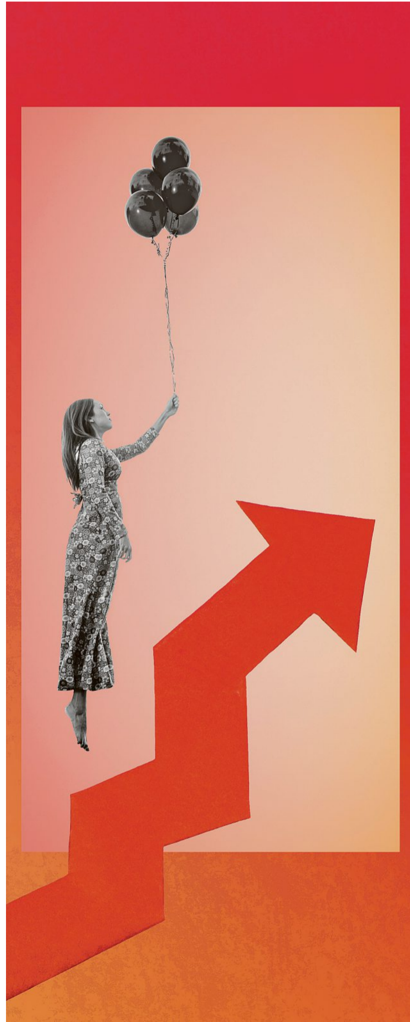
Illustration: Susse Heinz

Weibel Hess & Partner AG hat im Auftrag der SonntagsZeitung und der «Finanz und Wirtschaft» die Anbieter im 1e-Markt verglichen. Sie wurden mit einer verdeckten Ausschreibung für eine Unternehmung mit sechs Kadermitarbeitenden angeschrieben. Das Mystery Shopping zeigt die grossen Differenzen bei den Risiko- und Verwaltungskosten sowie den Stiftungsgebüh-